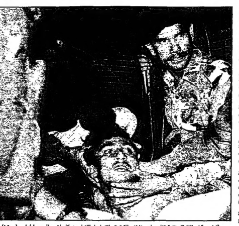
الرهائن من الطائرة الباكستانية يتقدمون لاعتقال خاطفيها خلال عملية الاطلاق سراحهم في مطار جوهانيسبرغ (جنوب أفريقيا)